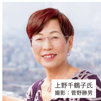
上野千鶴子氏